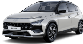
Lumen Grey Pearl / Black roof