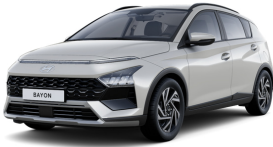
Lumen Gray Pearl