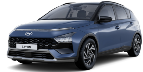
Vibrant Blue / Black roof