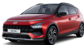
Dragon Red Pearl / Black roof