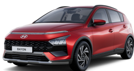
Dragon Red Pearl