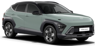
Mirage Green + Black Top