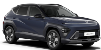
Denim Blue Pearl + Black Roof