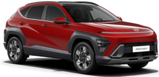
Ultimate Red Metallic