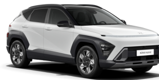
Atlas White + Phantom Black