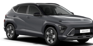
Ecotronic Gray/Black roof