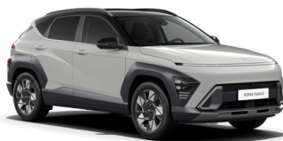
Cyber Grey + Phantom Black