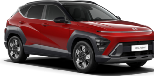
Ultimate Red/Black roof

NB. Visi paveikslėliai yra informacinio pobūdžio. Stogo, šoninių veidrodėlių, stogo skersinių, ratų skydelių, galinių langų ir pan. spalva priklauso nuo pasirinkto komplektacijos varianto.