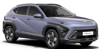
Meta Blue Pearl