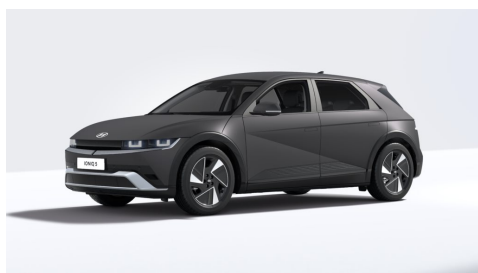
Ecotronic Gray Matte