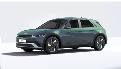
Digital Teal Green Pearl