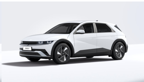
Atlas White Matte