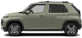
Bijarim Khaki Matte