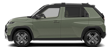
Tomboy Khaki + black roof