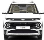
Aero Silver Matte