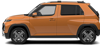
Sienna Orange Metallic