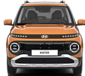
Sienna Orange Metallic