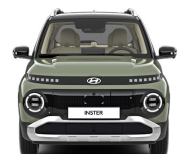
Tomboy Khaki + black roof