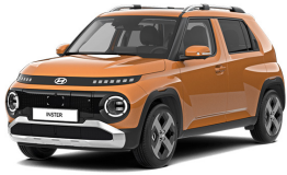
Sienna Orange Metallic