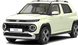
Buttercream Yellow Pearl