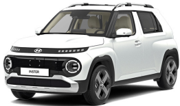
Aero Silver Matte