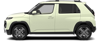
Buttercream Yellow Pearl