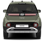
Bijarim Khaki Matte