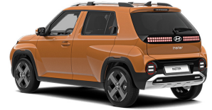
Sienna Orange Metallic