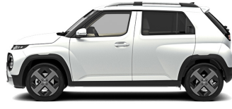
Aero Silver Matte