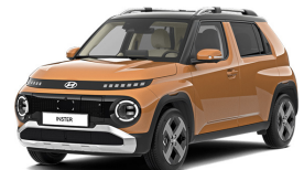
Sienna Orange + black roof