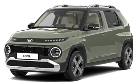
Tomboy Khaki + black roof