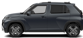
Dusk Blue Matte