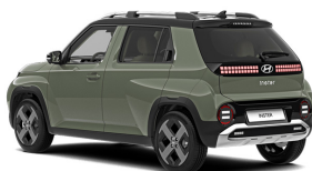
Tomboy Khaki + black roof