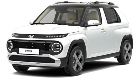
Aero Silver + black roof