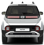
Aero Silver Matte