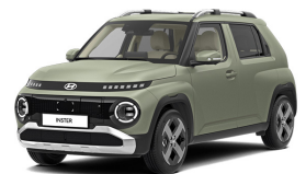
Bijarim Khaki Matte