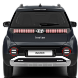
Dusk Blue Matte