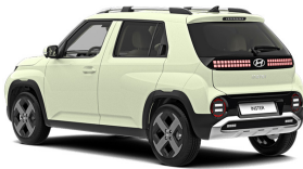
Buttercream Yellow Pearl