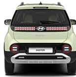
Buttercream Yellow Pearl