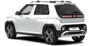
Aero Silver Matte