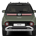
Tomboy Khaki + black roof