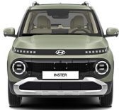
Bijarim Khaki Matte