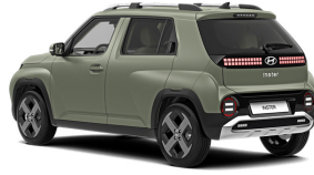
Bijarim Khaki Matte