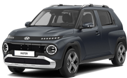
Dusk Blue Matte