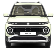
Buttercream Yellow Pearl