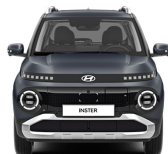
Dusk Blue Matte