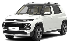
Atlas White + black roof