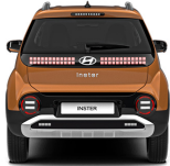
Sienna Orange Metallic