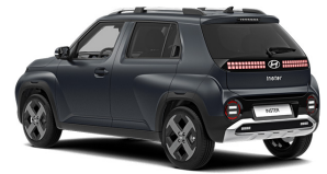
Dusk Blue Matte