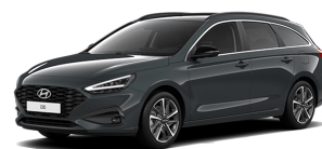
Cypress Green Pearl