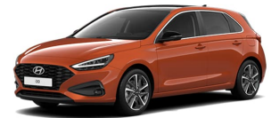
Jupiter Orange Metallic