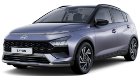
Meta Blue Pearl / Black roof