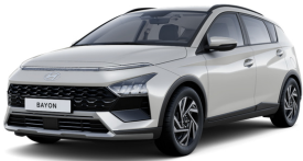
Lumen Gray Pearl