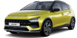
Lucid Lime Metallic / Black roof