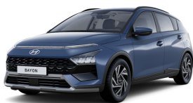
Vibrant Blue Pearl

NB. Visi paveikslėliai yra informacinio pobūdžio. Stogo, šoninių veidrodėlių, stogo skersinių, ratų skydelių, galinių langų ir pan. spalva priklauso nuo pasirinkto komplektacijos varianto.