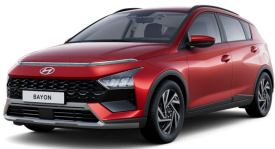
Dragon Red Pearl