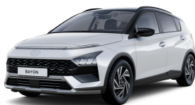
Atlas White / Black roof