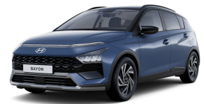
Vibrant Blue / Black roof