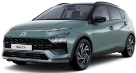
Green Pearl / Black roof